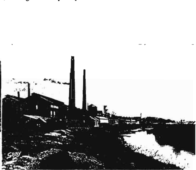
9 - BASSE-INDRE (Loire-Inf.) - Les Forges

Vous traversez la chaussée et rejoignez les quais, étincelant de mille couleurs. Promenez-vous un peu, toujours en direction de l'ouest, dans le quartier des pêcheurs . Vous allez y rencontrer de pittoresques rues étroites, dites venelles, aux noms évocateurs : rues de la Raie, de l'Anguille, de la Marine... Ah ! si seulement ces noms avaient pu être conservés ! Mais aussi de belles maisons de cadres des Forges, de capitaines au long cours, avec des grilles en fer forgé et des caborneaux donnant sur le quai.