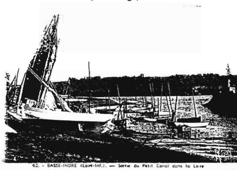
62 - BASSE-INDRE (Loire-Inf.) - Sortie du Petit Canal dans la Loire

18 - Quel village, situé au sud de la Loire, en organise depuis plus de cent ans ?